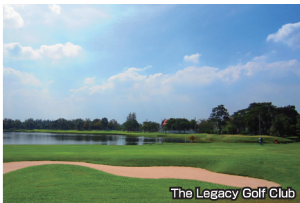
The Legacy Golf Club

J・ニコラウス設計で、湖を利用したウォーターハザードと、要所要所に現れるトリッキーなコースが特徴的。戦略性が必要です。