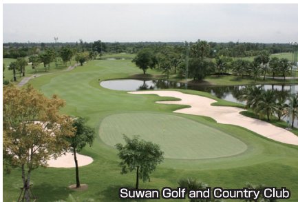
Suwan Golf and Country Club

アジアで最もエキサイティングなコースで、世界的にも評価が高い。田園都市の丘陵コースで、特にグリーンは高品質を保っている。