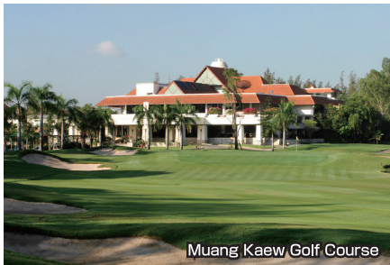
Muang Kaew Golf Course

バンコクの市街から最も好アクセスコースの一つ。全体にフラットで広めですが、砲台グリーンが絶妙の難易度を演出しています。