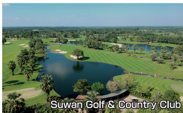
Suwan Golf &amp; Country Club