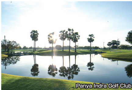
Panya Indra Golf Club

フラットなコースだが、全てにウォーターハザードが絡み見た目より難易度が高い。アイランドグリーンも多く戦略性が必要。