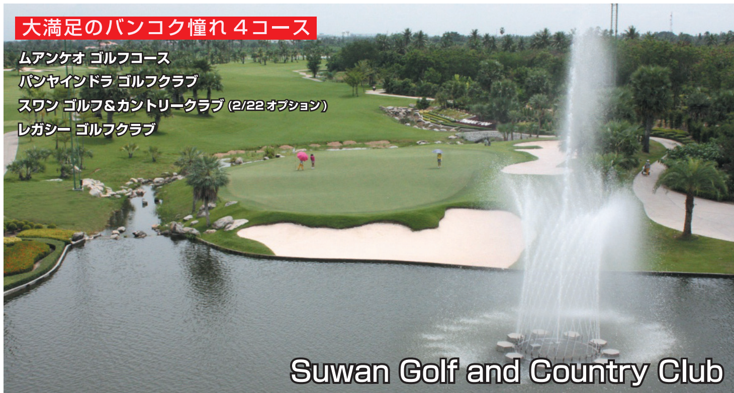
Suwan Golf and Country Club