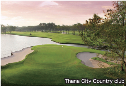
Thana City Country Club

ピート・ダイ設計の秀逸なコース。池を巧みに活かしながら戦略性が大事な個人的なコース。