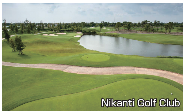
Nikanti Golf Club