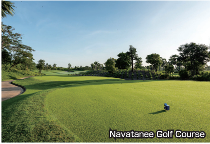
Navatane Golf Course

タイで初めて行われた「ワールドカップ」開催の為に造られた歴史ある名門コース。米国ゴルフダイジェスト誌のタイ国内ランキング1位にも輝いた実績も誇ります。