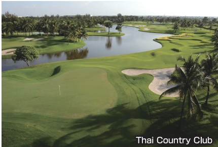
Thai Country Club

タイの名門コースとして有名。ホンダクラシックの舞台となりタイガー・ウッズが初の海外優勝した高級なコース。