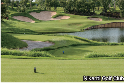
Nikanti Golf Club

ロング、ミドル、ショートが各6ホールずつで1番、7番、13番スタートのユニークなコース設計。2014年オープンの上級者向け高級なコース。