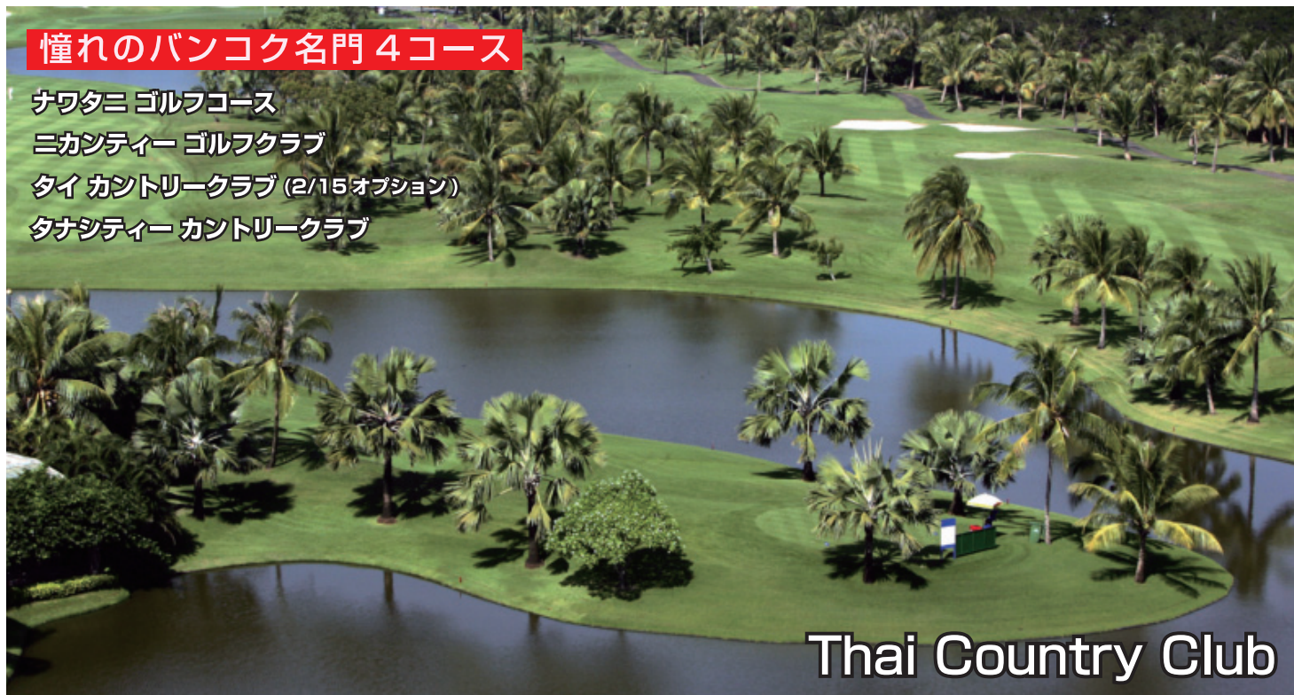
Thai Country Club