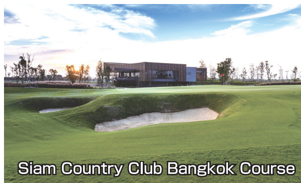
Siam Country Club Bangkok Course