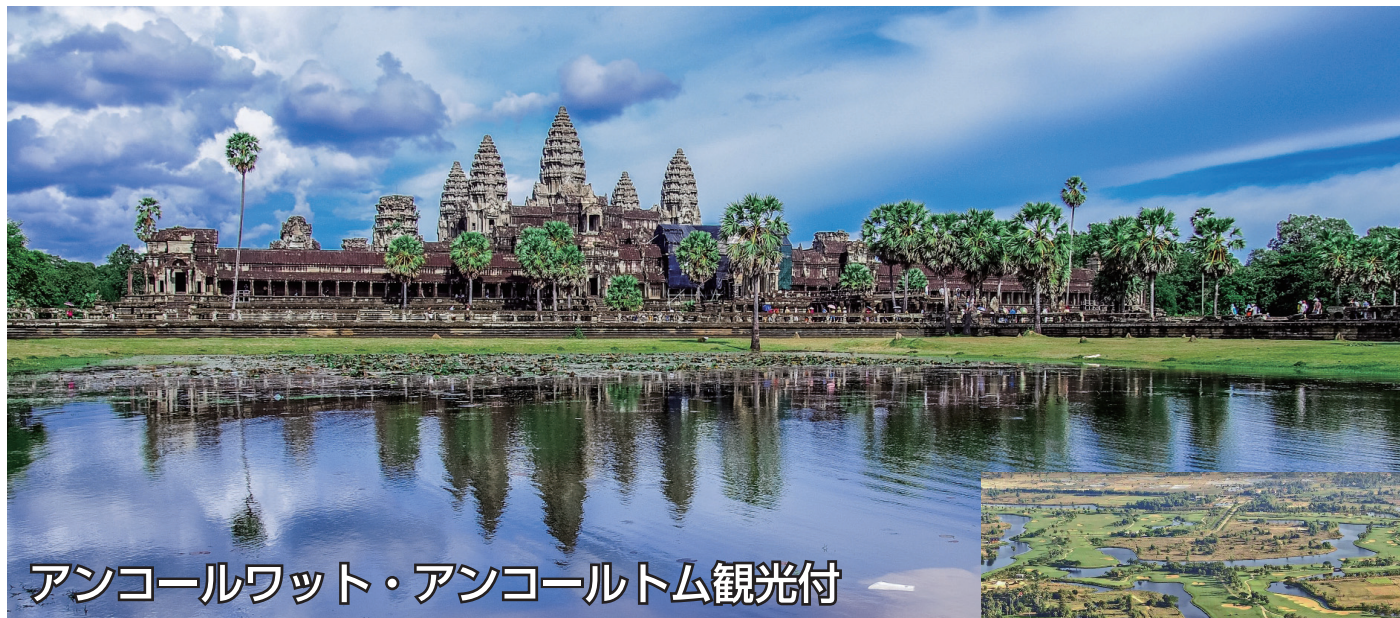
アンコールワット・アンコールトム観光付

3ラウンドプレー &amp; 朝食4回夕食1回・ディナーショー1回付 ゴルフ三昧の旅