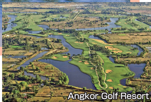
Angkor Golf Resort