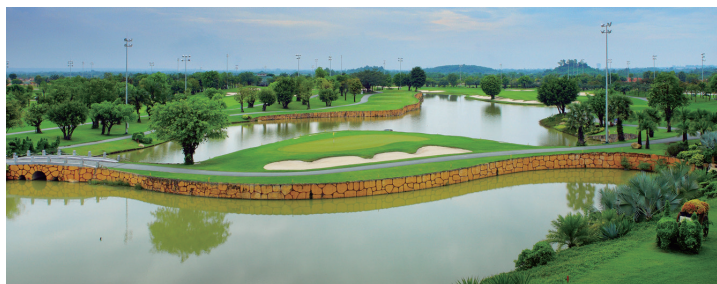
■ ロン タン ゴルフクラブ 36H / PAR144 コースメンテも非常に良く、美しい庭園に居るよう。