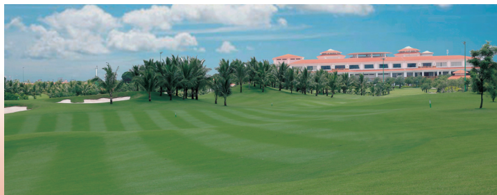
■ タン ソン ニャット ゴルフコース 36H / PAR144 2015年にオープンの新しいコース。市内から約30分、豪華なクラブハウス。