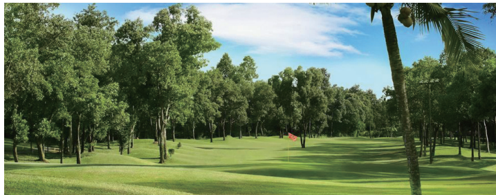
■ ベトナム ゴルフ & カントリー クラブ 36H / PAR144 1997年 PGA 開催。アンジュレーションの強いコース。