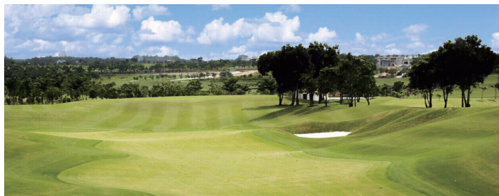
■ ハーモニー ゴルフ パーク 18H / PAR72 2018年オープン、東南アジア最大170ヤードのグリーン、最大のバンカーが特徴。