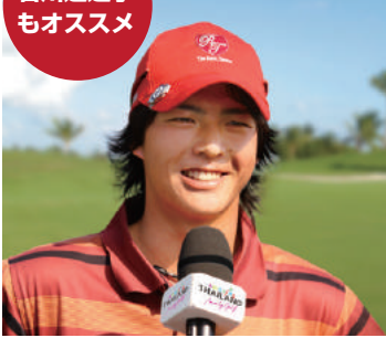
タイ・ゴルフ観光親善大使 石川遼選手 タイは笑顔が素敵で温かい方が多く、ゴルフも本当に心地よく楽しめます。みなさんもタイのゴルフ旅行をぜひお楽しみください。